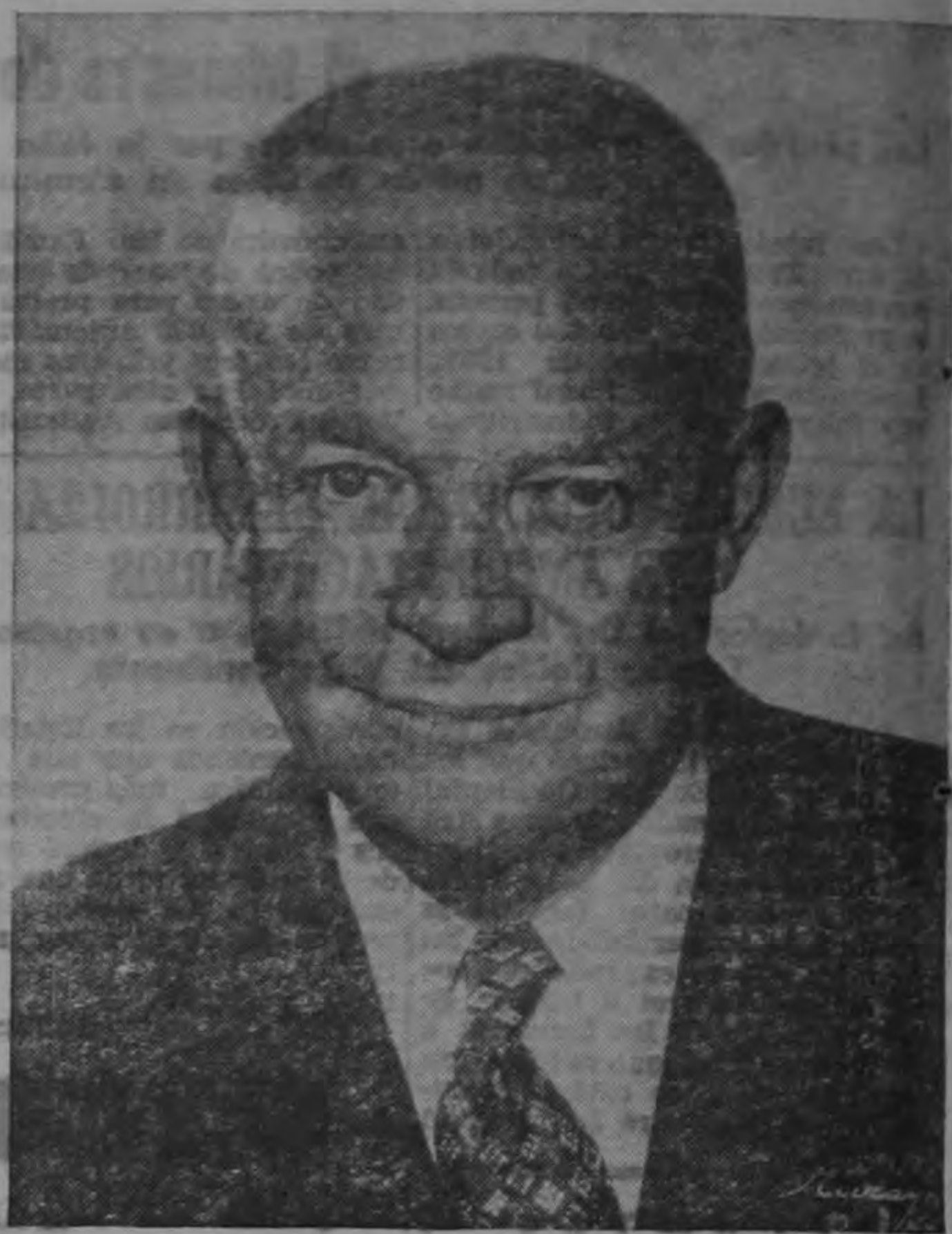
General DWIGHT D. EISENHOWER, 34º Presidente de los Estados Unidos de América, quien inaugura su periodo de Gobierno hoy martes 20 de enero de 1953.

El nuevo Presidente de los Estados Unidos de América