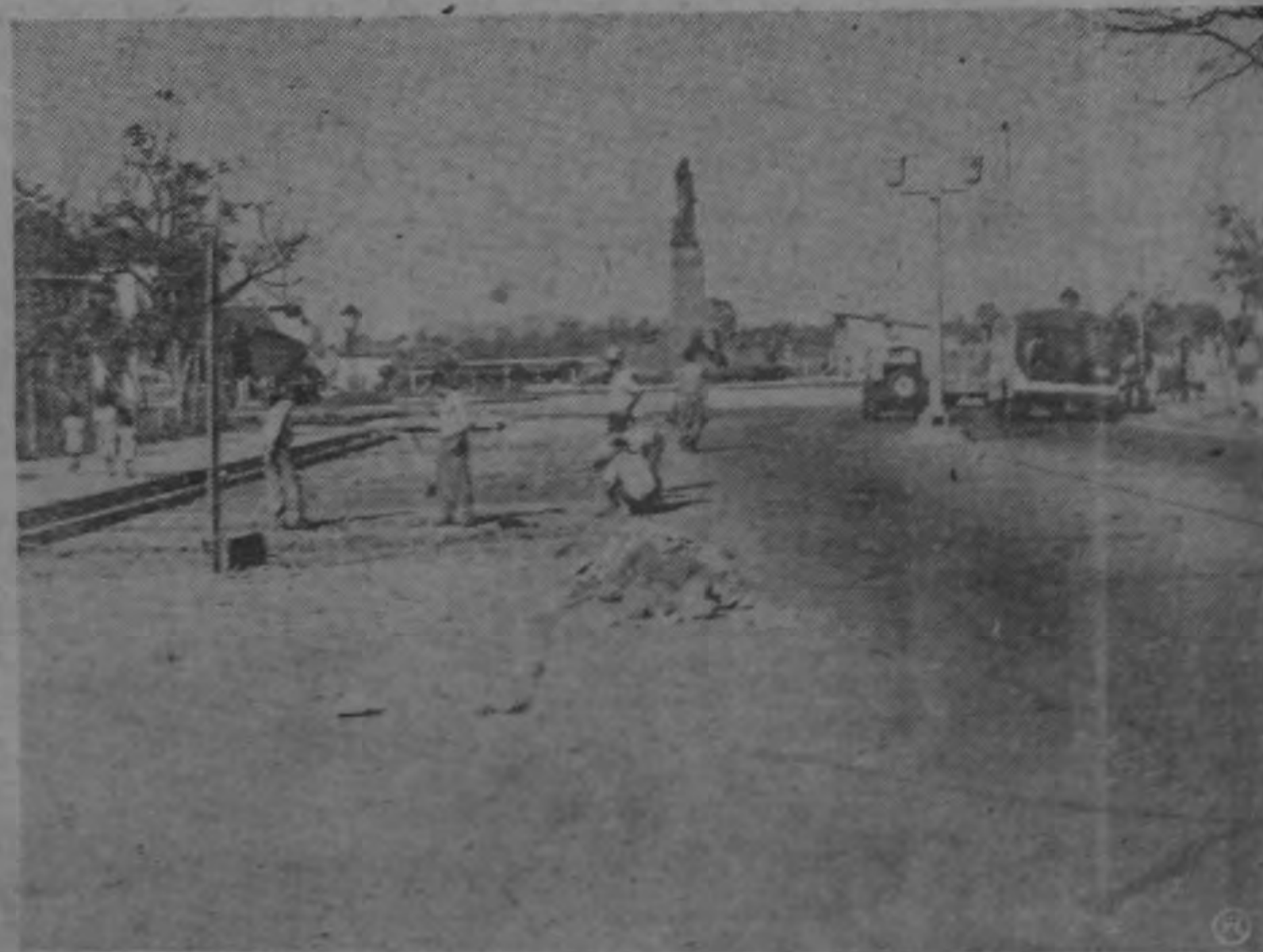
OTRA GRAN ARTERIA —Rápidamente están avanzando los trabajos de ensanche del Paseo Colón. El jardincillo lateral Sur y todo el espacio que ocupaba la línea del tranvía, se están convirtiendo en magnífica avenida moderna, de hierro y concreto. Es otra de las grandes arterias con que ha de contar en breve nuestra capital. En las vistas se puede apreciar un aspecto de los trabajos, y la perspectiva que presenta el tramo de más de doscientas varas que ya ha sido terminado, y que tiene al fondo el Monumento a León Cortés.